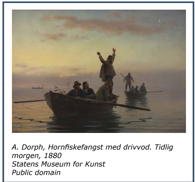
A. Dorph, Hornfiskefangst med drivvod. Tidlig morgen, 1880 Statens Museum for Kunst Public domain