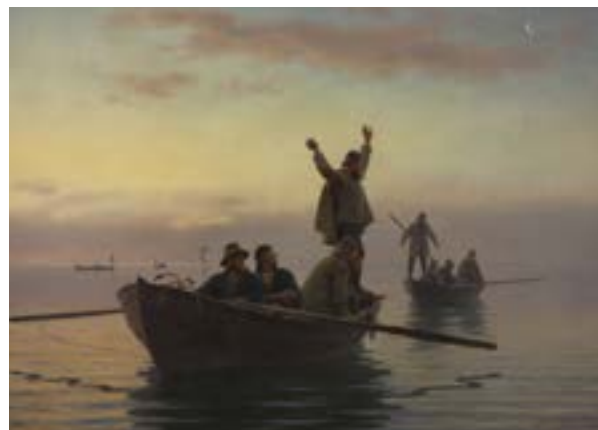
A. Dorph, Hornfiskefangst med drivvod, 1880 Statens Museum for Kunst Public Domain

nimm hier auf beiden Seiten des MM 1 M zu, indem Du den Querfaden zwischen den M re verschränkt strickst. Beginne an der Markierung für die jeweilige Größe im Diagramm und stricke das Muster, während gleichzeitig 1 M auf beiden Seiten des MM in jeder 4. Runde zugenommen wird, insgesamt 24 (25) 26 (27) Mal (= 100 (106) 112 (118) M). Fahre gerade fort, bis der Ärmel ca. 46 cm misst oder die gewünschte Länge hat und ende mit der gleichen Runde im Muster wie am Körper.