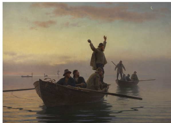
A. Dorph, Hornfiskefangst med drivvod, 1880 Statens Museum for Kunst Public Domain

bis die Arbeit eine Länge von 8 cm misst. Wechsle zum Nadelspiel 3,5 mm und platziere einen MM in die 1. M der Runde. Stricke 1 Runde re und nimm hier auf beiden Seiten des MM 1 M zu, indem Du den Querfaden zwischen den M re verschränkt strickst. Beginne an der Markierung für die jeweilige Größe im Diagramm und stricke das Muster, während gleichzeitig 1 M auf beiden Seiten des MM in jeder 4. Runde zugenommen wird, insgesamt 24 (25) 26 (27) Mal (= 100 (106) 112 (118) M). Fahre gerade fort, bis der Ärmel ca. 46 cm misst oder die gewünschte Länge hat und ende mit der gleichen Runde im Muster wie am Körper.