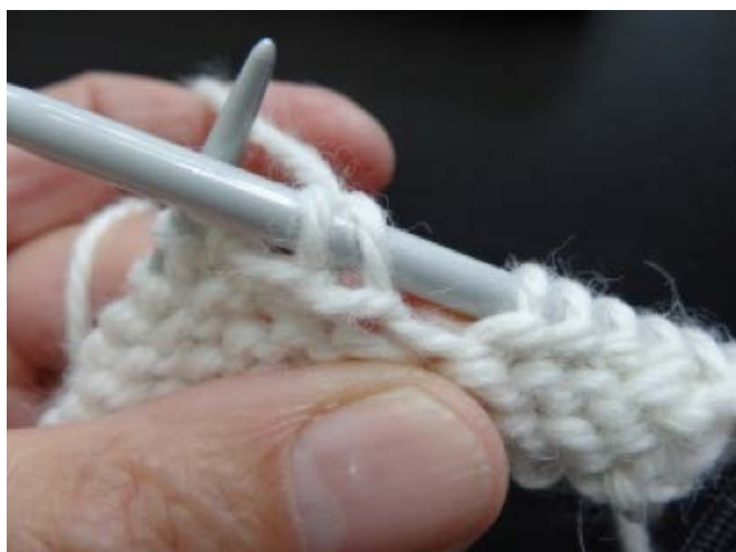
Billede 2. Stram garnet (dobbelmaske).