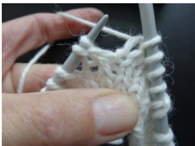
Billede 3. Næste p: strik til dobbelmasken.