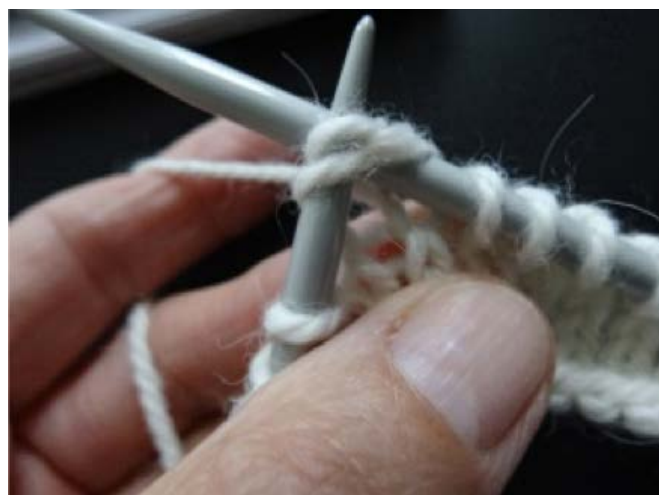
Billede 4. Strik sammen