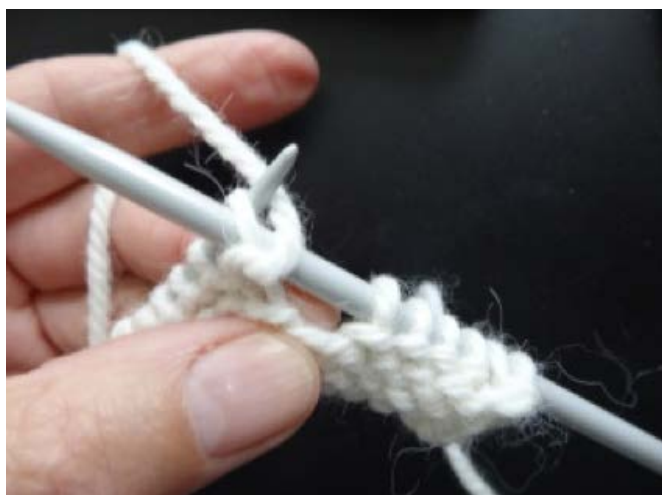
Billede 1. Tag første vr m løs af.